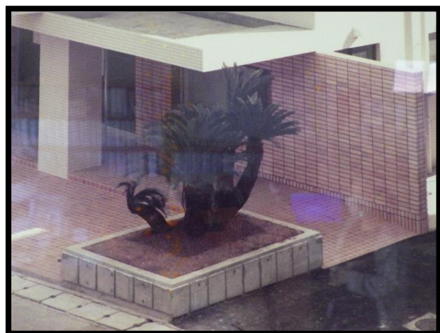
←開館当初のソテツ